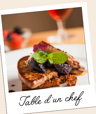
Table d'un chef

Cette journée est une invitation à la découverte et au raffinement. Entre la richesse des vins, la sophistication de la cuisine locale et la qualité exceptionnelle des produits artisanaux, cette journée est conçue pour les épicuriens en quête d'expériences uniques et mémorables. Laissez vous séduire par la générosité et le savoir-faire du Sud-Ouest, et repartez avec des souvenirs impérissables.