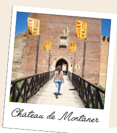
Château de Montaner

Acheminement sur place & transferts entre les différents prestataires, tarifications optionnelles, achats personnels des clients sur place.